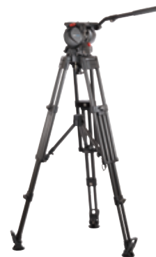
SX300 雲台 + TTH1502C 3段カーボン三脚 + TML150 mid-level spreader (floor pad付属)